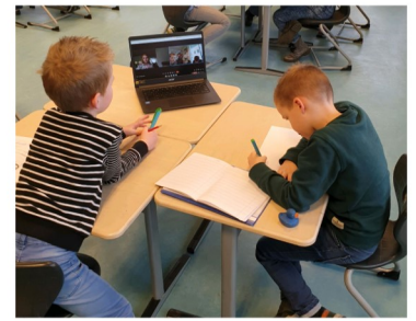
Samenwerken op school en thuis